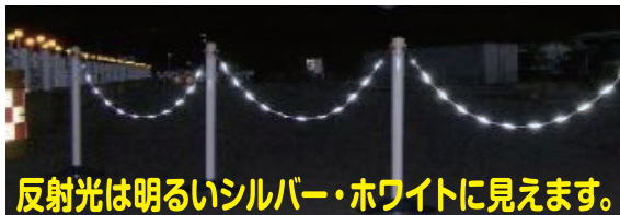
反射光は明るいシルバー・ホワイトに見えます。