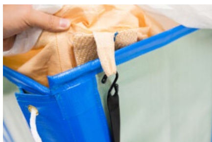
フレコン袋落下防止フック付