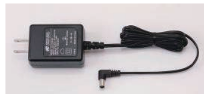
AC アダプター (充電時間約10時間) KSLY-SC